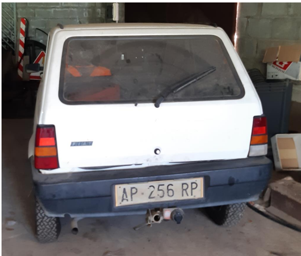
Figura 3- FIAT PANDA 4X4