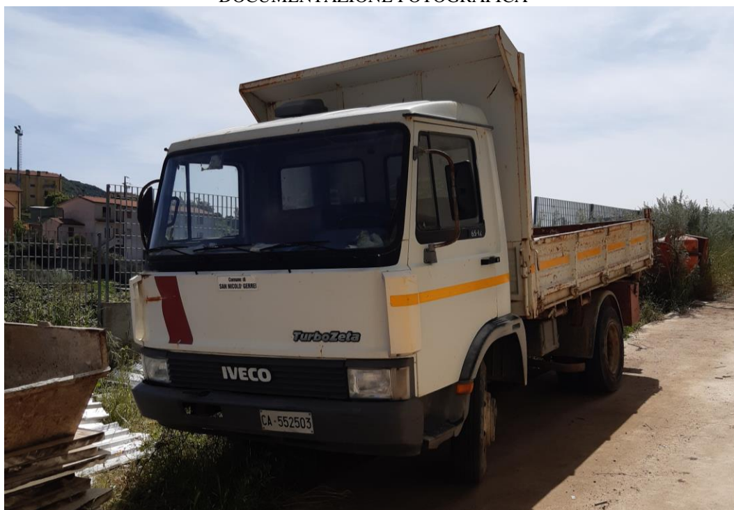
Figura 1- FIAT IVECO