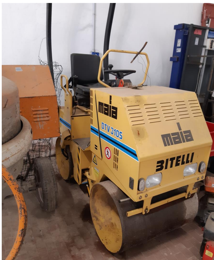
Figura 2 - RULLO